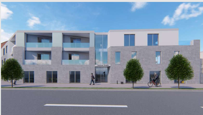
Ansicht Hammer Str.